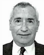
Integrante (MORENA) Dip. Raúl Eduardo Bonifaz Moedano